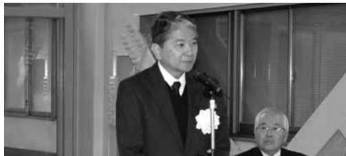
安川医学部長による挨拶