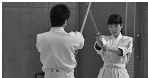
剣道部による演武

続いて、武道系各部(剣道部、合気道部、空手道部、柔道部)の学生が演武を披露し、集まった約120人の参加者から暖かい拍手が送られました。