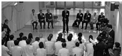
柳澤学長による祝辞