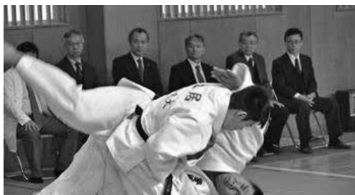
柔道部による演武