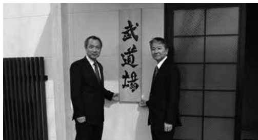
看板上掲式の様子

医学部では、現在、学生等の教育環境改善事業を進めています。その一環として、2月14日(金)に武道場の改修工事が竣工となり、これを記念して武道場開きを行いました。