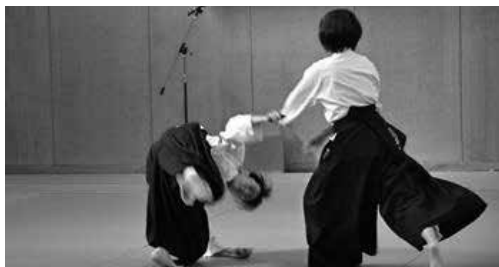
合気道部による演武