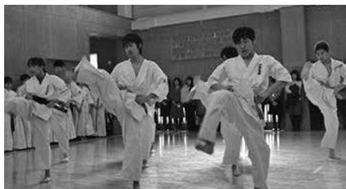
空手道部による演武