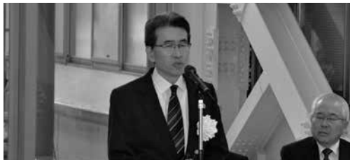
大西手術手技研修センター長による挨拶