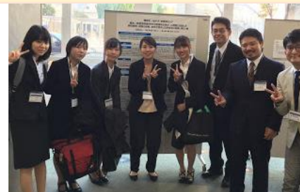
（学会発表での様子）