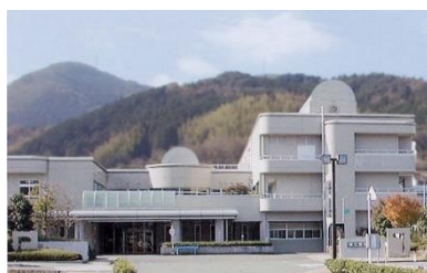
西予市立野村病院