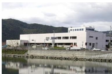
宇和島市立津島病院