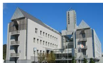
愛媛県立南宇和病院