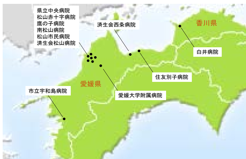
愛媛大学眼科関連施設の分布図

愛媛大学附属病院は松山市に隣接し、愛媛県のほぼ中央に位置する東温市にあります。松山市には中核病院である県立中央病院(常勤5名・非常勤1名)、松山赤十字病院(常勤5名・非常勤1名)と4つの連携施設(常勤計8名)があります。愛媛県の南部には中核病院である市立宇和島病院(常勤5名・非常勤1名)、東部には中核病院である住友別子病院(常勤4名)と、1つの連携施設(常勤1名)があります。また香川県西部には1つの連携施設(常勤6名)があります。