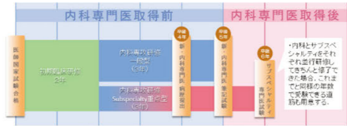
(日本内科学会 HP より抜粋)

内科専門医取得に必要な内科13領域(総合内科、消化器、循環器、内分泌、代謝、腎臓、呼吸器、血液、神経、アレルギー、膠原病・類縁疾患、感染症、救急)の疾患を効率よく経験し、最終的には70疾患群、200以上の症例取得を目指します。そのうち修了要件160症例の1/2に相当する80症例は、初期臨床研修中に経験した症例であっても良い。