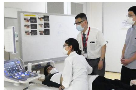
腹部エコーハンズオンセミナー