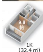
1K (32.4 m)