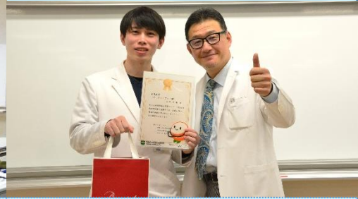
研修修了記念センター長杯 2022年 チーフレジデント賞