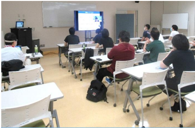
外部講師によるオンラインセミナー 「2年間の研修で押さえておくべきポイント集」