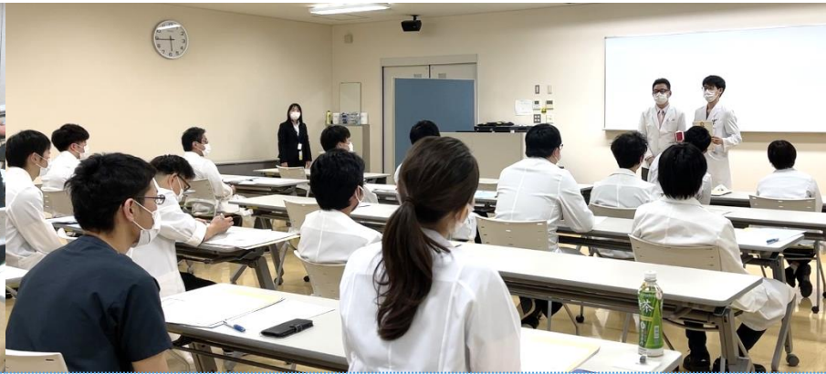
研修修了記念センター長杯 (学会発表部門)