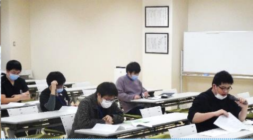
ジャーナルクラブ