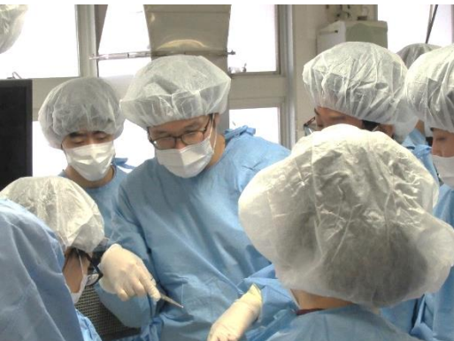
キャダバートレーニング (ご遺体を用いた手術手技トレーニング)

医学生皆さんへ。 各診療科の指導体制が整っているのが大学病院での臨床研修の特徴です。そこに加えて、センター長に就任して以来、研修医の要望に応じてハードもソフトも充実させて来ました。研修と研鑽の棲み分けによる大幅な収入アップ、一次・二次救急の支援体制見直し、研修医による研修医のための勉強会（KKB）や実践的なハンズオンセミナーの導入、研修医向け図書を購入、電子カルテ・PC・コピー機の増設……。これからも皆さんと一緒に「研修医による研修医のための臨床研修プログラム」のバージョンアップを図ってまいります。