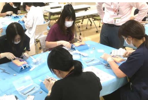
皮膚科主催 縫合研修（局所皮弁など）