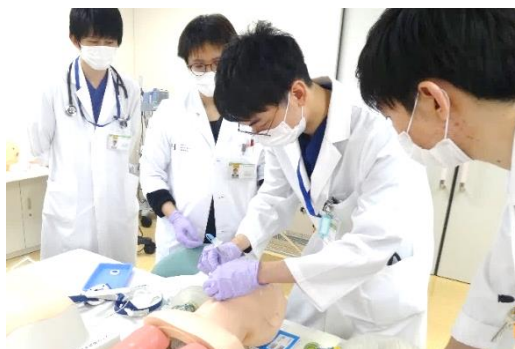
気管挿管ハンズオンセミナー