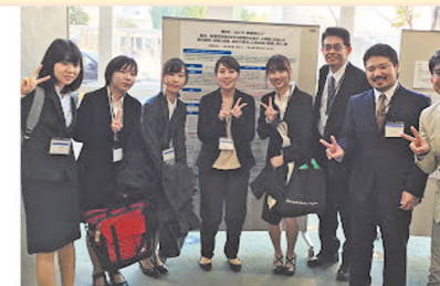
(学会発表での様子)