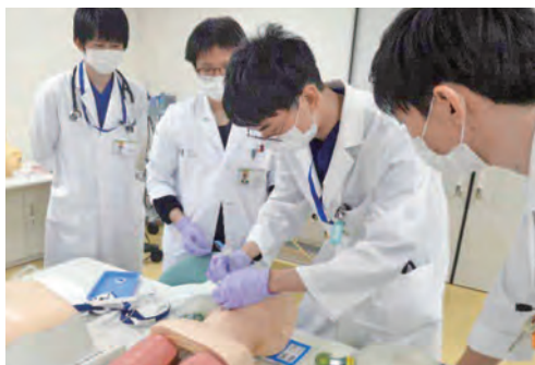
気管挿管ハンズオンセミナー