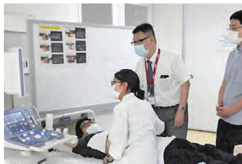
腹部エコーハンズオンセミナー