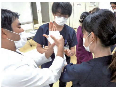
シーネ固定ハンズオンセミナー