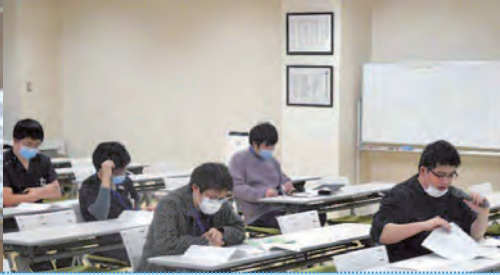
ジャーナルクラブ