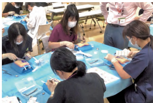
縫合研修（局所皮弁など）