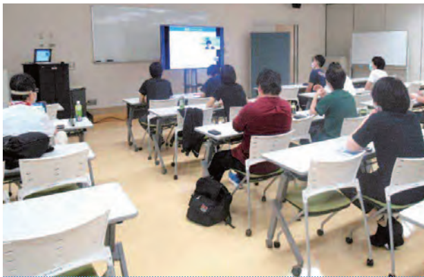
外部講師によるオンラインセミナー 「2年間の研修で押さえておくべきポイント集」