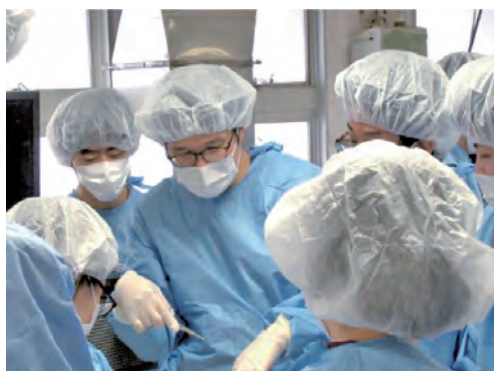
キャダバートレーニング (ご遺体を用いた手術手技トレーニング)

各診療科の指導体制が整っているのが大学病院での臨床研修の特徴です。そこに加えて、センター長に就任して以来、研修医の要望に応じてハードもソフトも充実させて来ました。研修と研鑽の棲み分けによる大幅な収入アップ、一次・二次救急の支援体制見直し、研修医による研修医のための勉強会（KKB）や実践的なハンズオンセミナーの導入、研修医向け図書を購入、電子カルテ・PC・コピー機の増設……。これからも皆さんと一緒に「研修医による研修医のための臨床研修プログラム」のバージョンアップを図ってまいります。