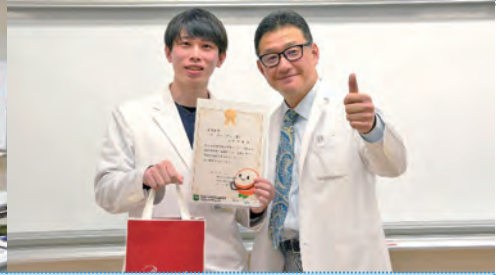
研修修了記念センター長杯 チーフレジデント賞