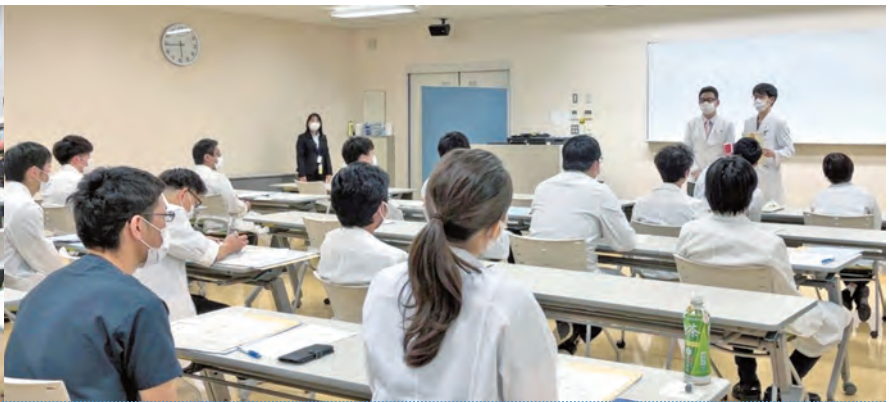
研修修了記念センター長杯 (学会発表部門)