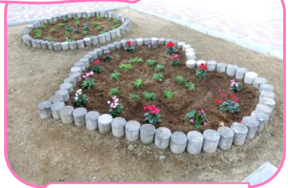
花壇部門がお世話を する花壇