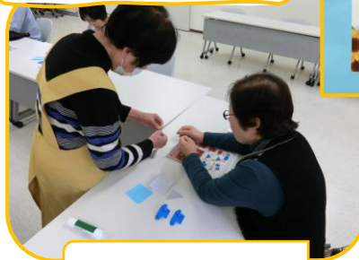
折り紙教室の様子