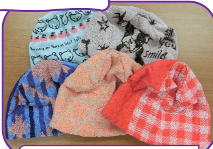
タオル一枚を裁断なしで 作ったタオル帽子