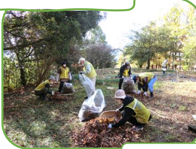
構内の清掃活動の様子