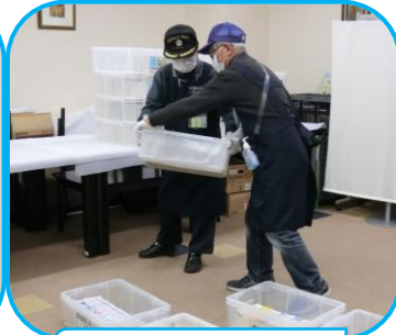
病棟配本の 準備の様子