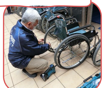
車椅子整備の様子