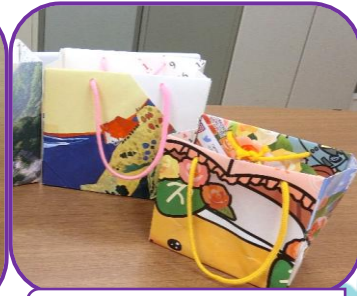
カレンダーで作った 紙袋