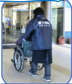
正面玄関での 介助支援の様子