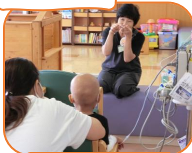
小児科病棟での おはなし会の様子